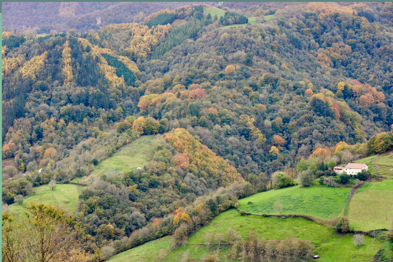
Arturo Elozegi editorearen argazkia